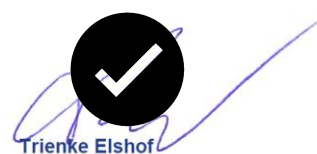
Trienke Elshof Voorzitter bestuur LTO Noord, regio Noo